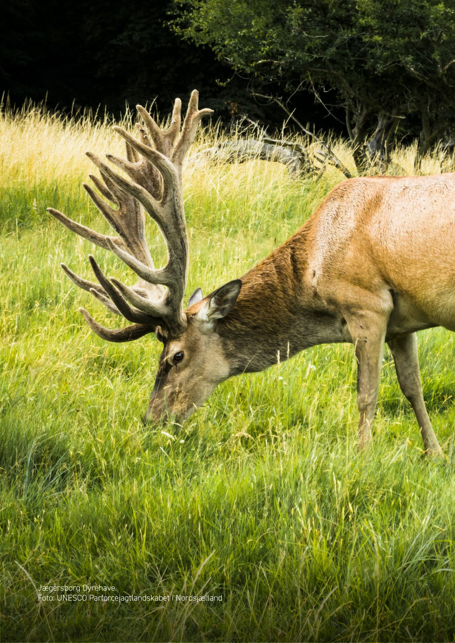
Jægersborg Dyrehave Foto: UNESCO Parforcejagtslandskabet i Nordsjælland