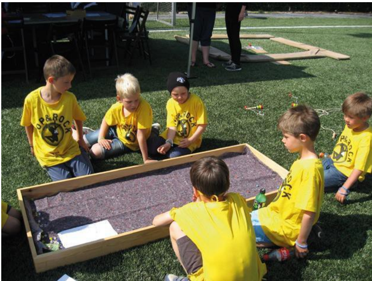
Rå Rudersdal Museers bod ved Hop og Rock 2016 kunne de besøgende børn lære at spille det gammeldags kuglespil Klink med glaskugler. (RM)

Medarbejdere fra Nyere tid/Mothsgården deltog også i et Golden Days-arrangement med fokus på arkitekturhistorie i 2016, ligesom medarbejdere fra alle Rudersdal Museers afdelinger medvirkede til afviklingen af arrangementet Hop og Rock for Rudersdal Kommunes skoleklasser.