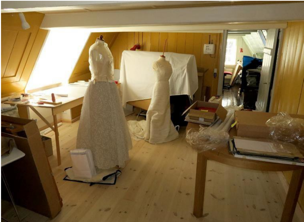
En stor del af udstillingsforberedelserne foregår på førstesalen af Mothsgårdens hovedbygning. (RM)