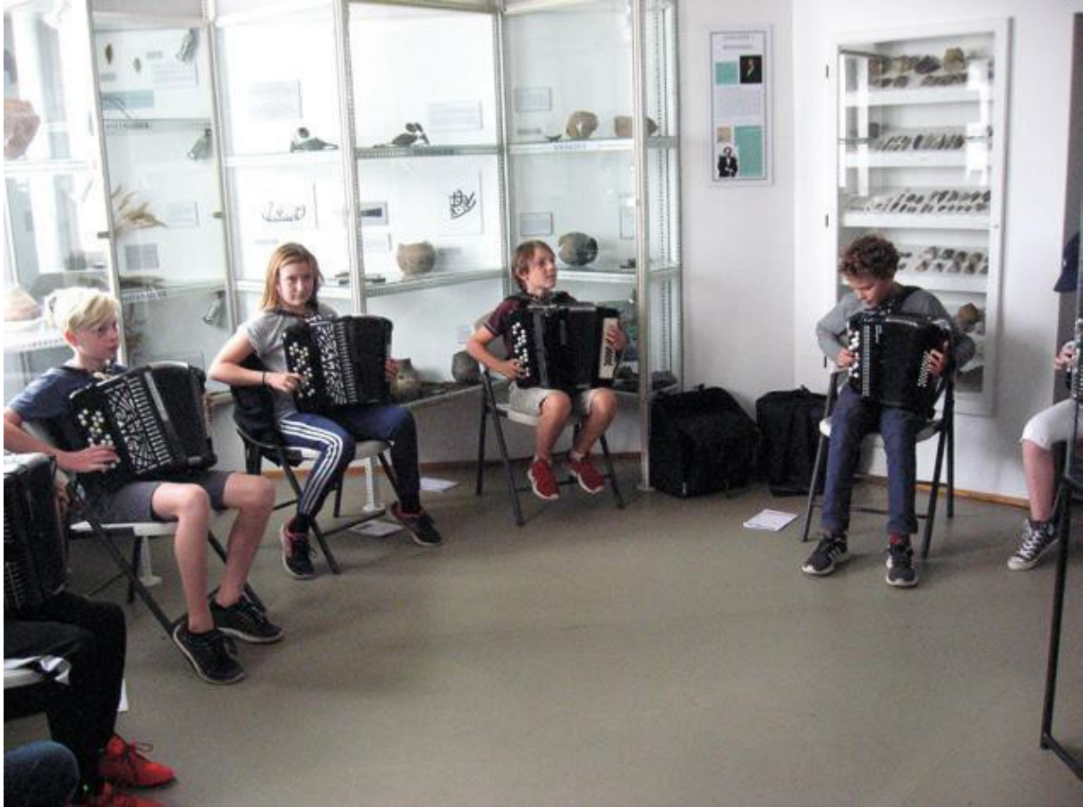
Børn fra Høsterkøb Skoles 5.A havde omsat deres besøg på Vedbækfundene til stemningsfulde toner på akkordeon