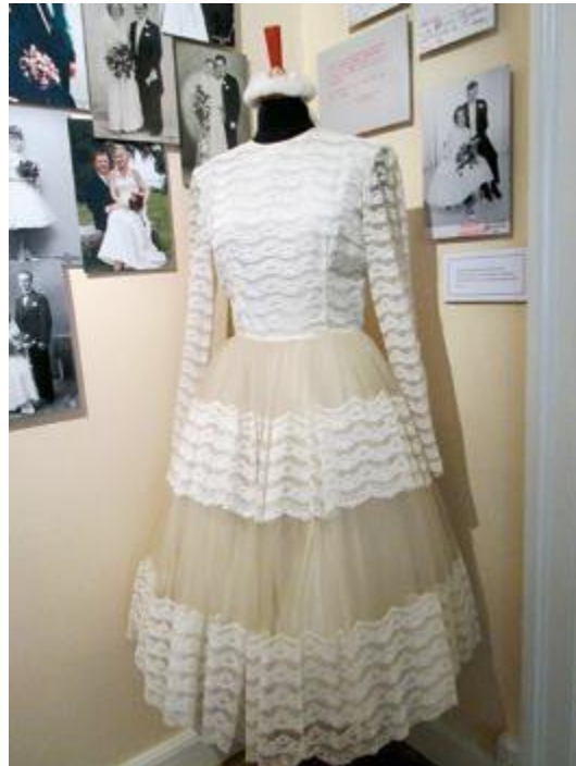
Brudekjole brugt i Søllerød kirke 1964. Afleveret til museet i forbindelse med årets særudstilling.