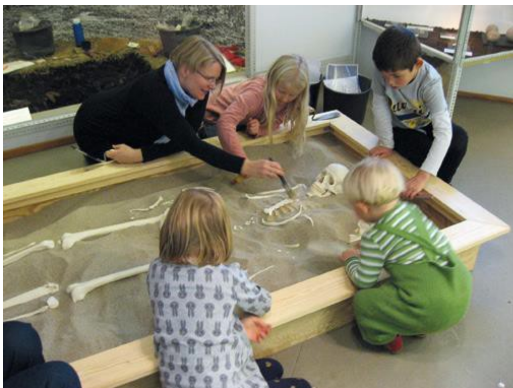
Både børn og voksne legede arkæologer i efterårsferien på Vedbækfundene.

Januar og begyndelsen af februar bød på arrangementet Lys og Mørke i jægerstenalderen, som er et arrangement udbudt til Rudersdal Kommunes børnehaver som en del af kulturpakken Smag på Kulturen. Det var sidste år med dette arrangement; Børneområdet skal spare ligesom alle andre og har derfor ikke råd til at betale for det mere. Vi vil selvfølgelig stadig få besøg af børnehaver fra kommunen, hvor de bare vælger at betale for omvisning af egen kasse.