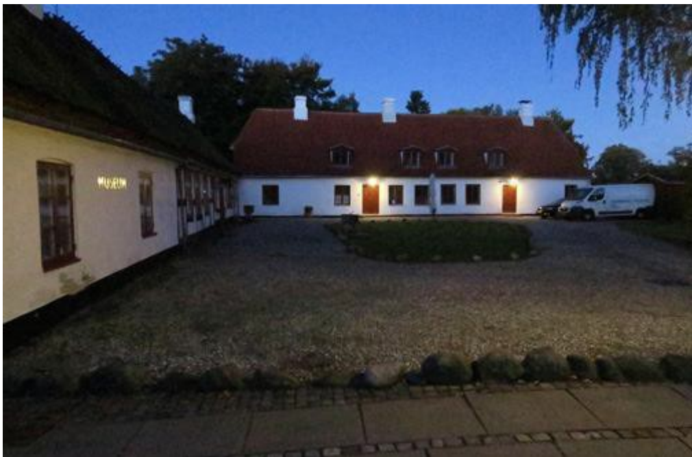
Skumringsbillede af Mothsgården med den nyrestaurerede hovedbygning.

Besøgstallet på Mothsgården steg en anelse i 2016 i forhold til 2015, på trods af, at der i 2016 kun blev åbnet én ny særudstilling. I 2017 vil der formentlig blive åbnet to nye særudstillinger, hvilket gerne skulle medføre en yderligere stigning i besøgstallet. Der blev afholdt mange arrangementer både på museerne og uden for murene, eksempelvis museets skov- og landskabshistoriske ture, som vi havde meget stor succes med i 2016.