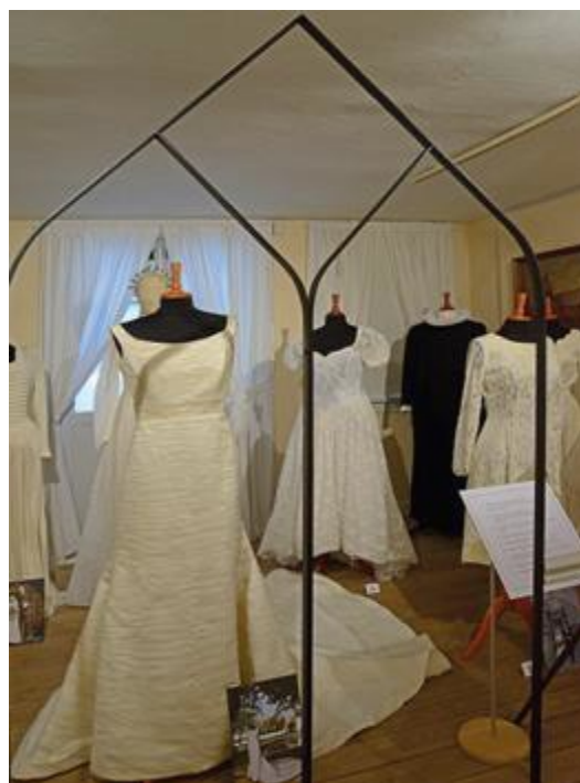
Bryllupskjoler og en enkelt præst i bryllupsrummet. Særudstillingen: Tøj til Højtid og Fest. (RM)