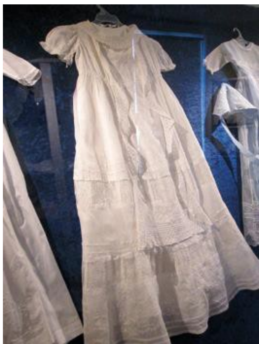
Dåbskjole brugt første gang i Birkerød Kirke 1907, senest brugt i år 2000. (RM)

Interessen var stor og udover omkring hundrede fotos - primært bryllupsbilleder - modtog museet blandt andet to dåbskjoler, fem konfirmationskjoler, syv brudekjoler samt flere interessante selskabskjoler. Den ældste kjole var fra 1907 og den nyeste fra 2011. Særligt glædeligt ved indsamlingskampagnen var, at museet herved også kraftigt fik udbygget sin samling af dragter fra den tidligere Birkerød Kommune.