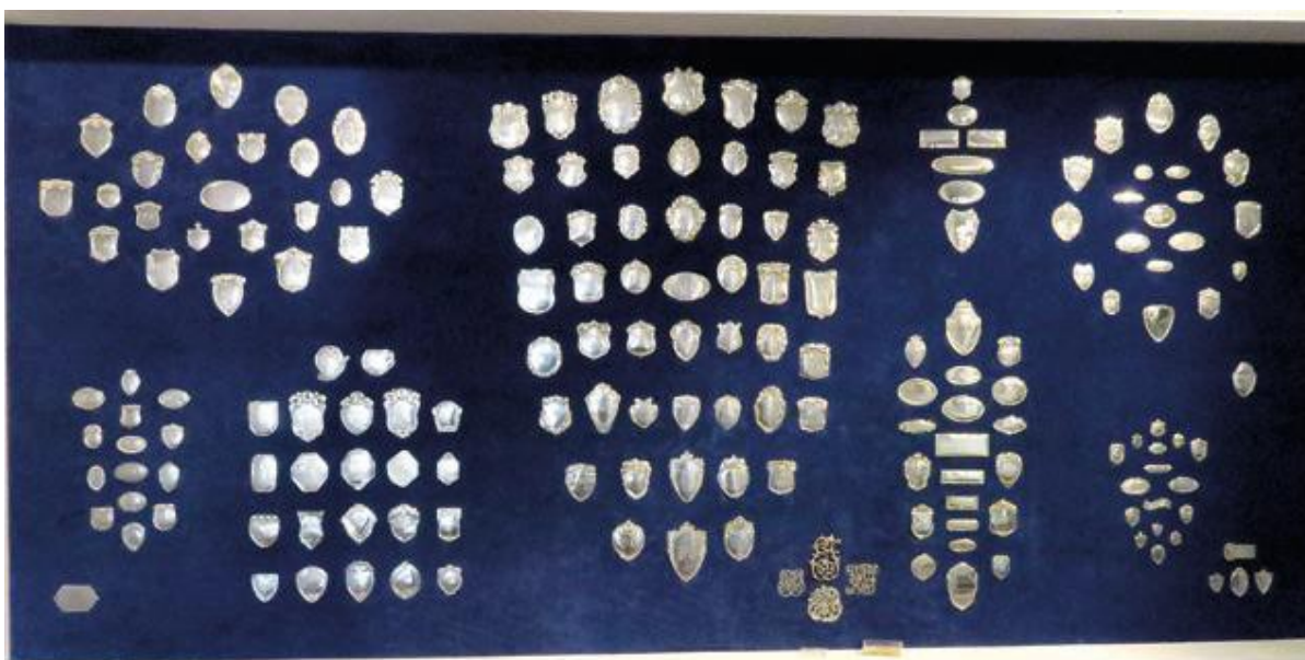
Forberedelser til Tøj til Højtid og Fest: Et udvalg af den fine samling af frakkeskjolde. (RM)