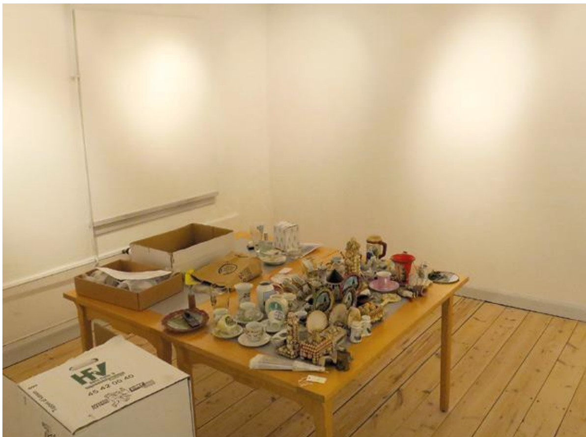
Farvel til særudstillingen "Abverdens Souvenirs" – forberedelserne til Tøj til Højtid og Fest er begyndt. (RM)