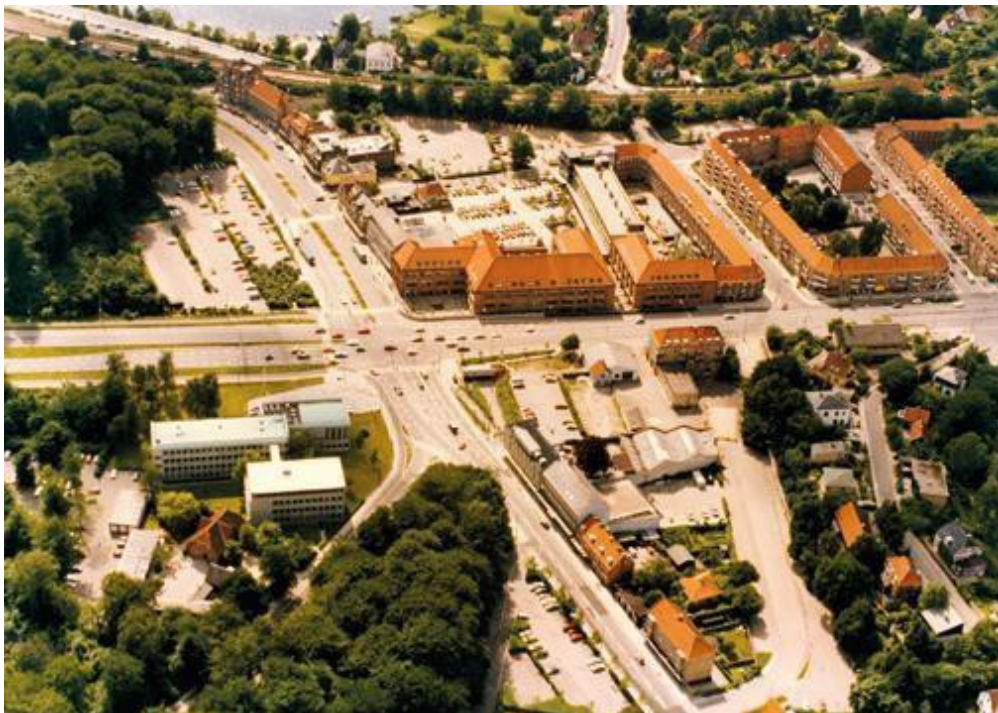
Lufifoto af krydset Kongevejen/Øverødvej, fra slutningen af 1980'erne. Fra Historisk Arkivs udstilling ByBilleder. (HA)

Historisk Arkiv gennemførte ud over det løbende arbejde med indsamling og registrering blandt andet historiske quizzer, byvandring og ”Arkiv på Hjul”- arrangementer i 2016, og ydede en stor indsats i forbindelse med Nærum Kulturdag. Året bød også på arkivets udstilling ”ByBilleder”, om byrummets visuelle udvikling. Der blev i 2016 arbejdet med forberedelse af Historisk Arkivs flytning til Nordlængen ved Biblioteket i Nærum, hvor der skal etableres en ny læsesal og et bibliotek, hvor Mothsgårdens, Arkivets og andre relevante bogsamlinger opstilles sammen i et fint, nyt lokalhistorisk studiecenter i Nærum.