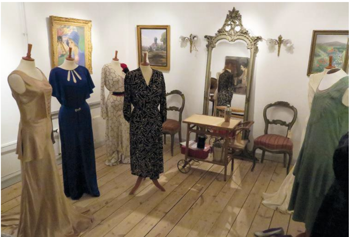
Udstillingen Tøj til Højtid og Fest. (RM)