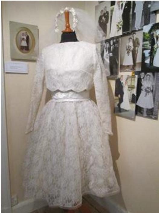
Brudekjole med bolerojakke og slør fra bryllup i Birkerød kirke 1965. Afleveret til museet i forbindelse med årets særudstilling (RM)