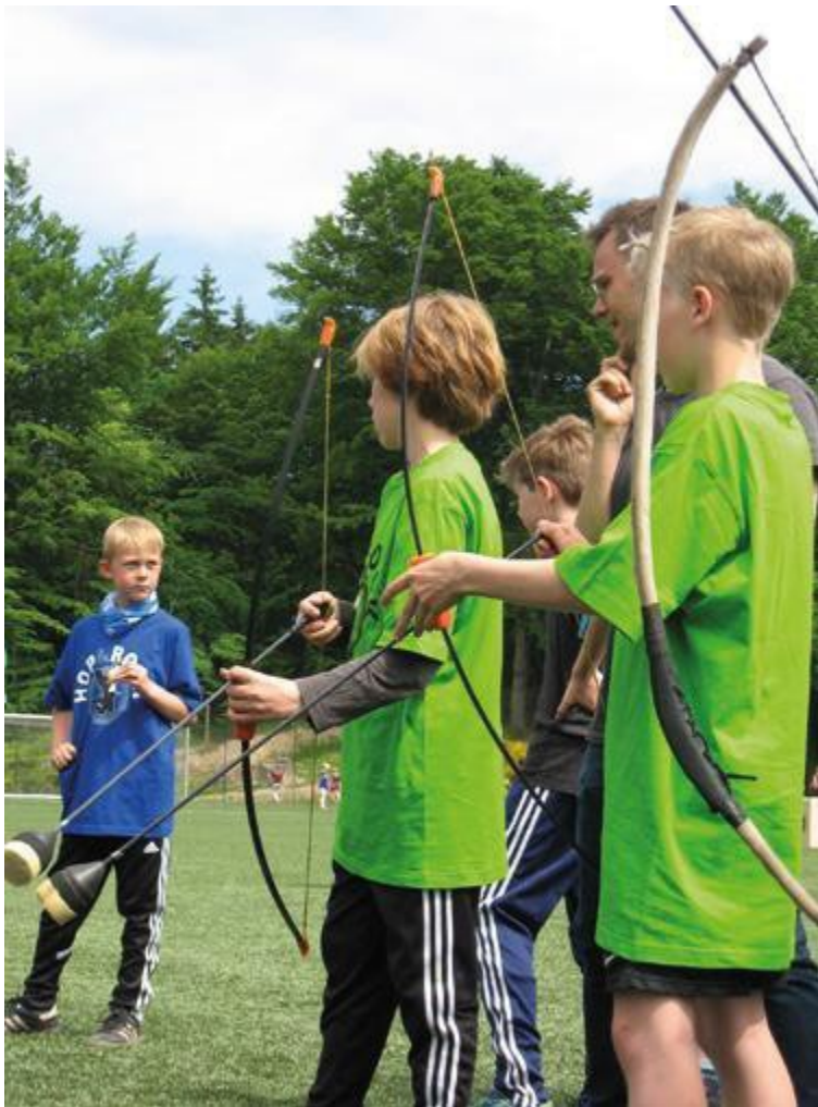
Børn til bueskydning ved Hop og Rock på Rudegård Stadion 2016.