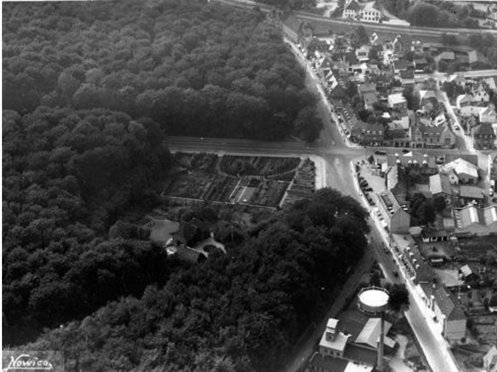
Luftfoto af krydset Kongevejen/Øverødvej, foto fra 1939. Fra Historisk Arkivs udstilling Bybilleder. (HA)