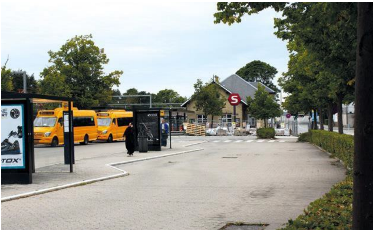
Birkerød Station fotograferet i 2016 til Historisk Arkivs udstilling ByBilleder.