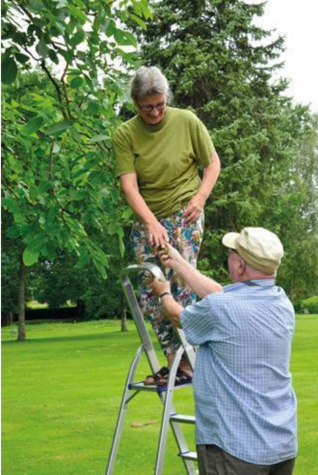
Der plukkes valnødder i Mothsgårdens have til brug for fremstilling Af Museets valnøddesnaps.