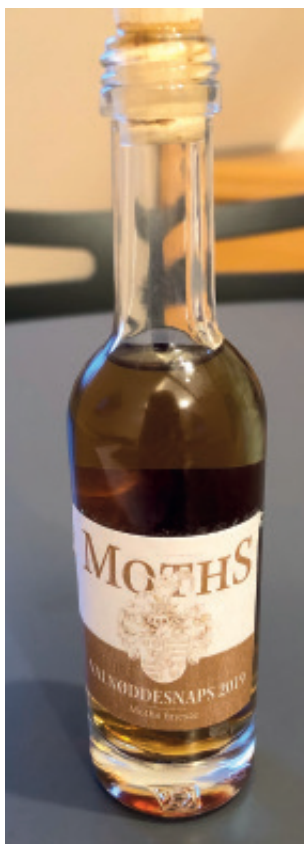
Den traditionelle valnøddesnaps i nye klæde på Mothsgården

Rudersdal Museer er også en forretning, hvor indtægter fra butikssalg og private arrangementer er vigtige. Derfor har museet udviklet et koncept, der bygger på Matthias Moth. Konceptet har sit eget genkendelige design og navn "Moths fineste". Museets valnøddesnaps tog derfor navneforandring