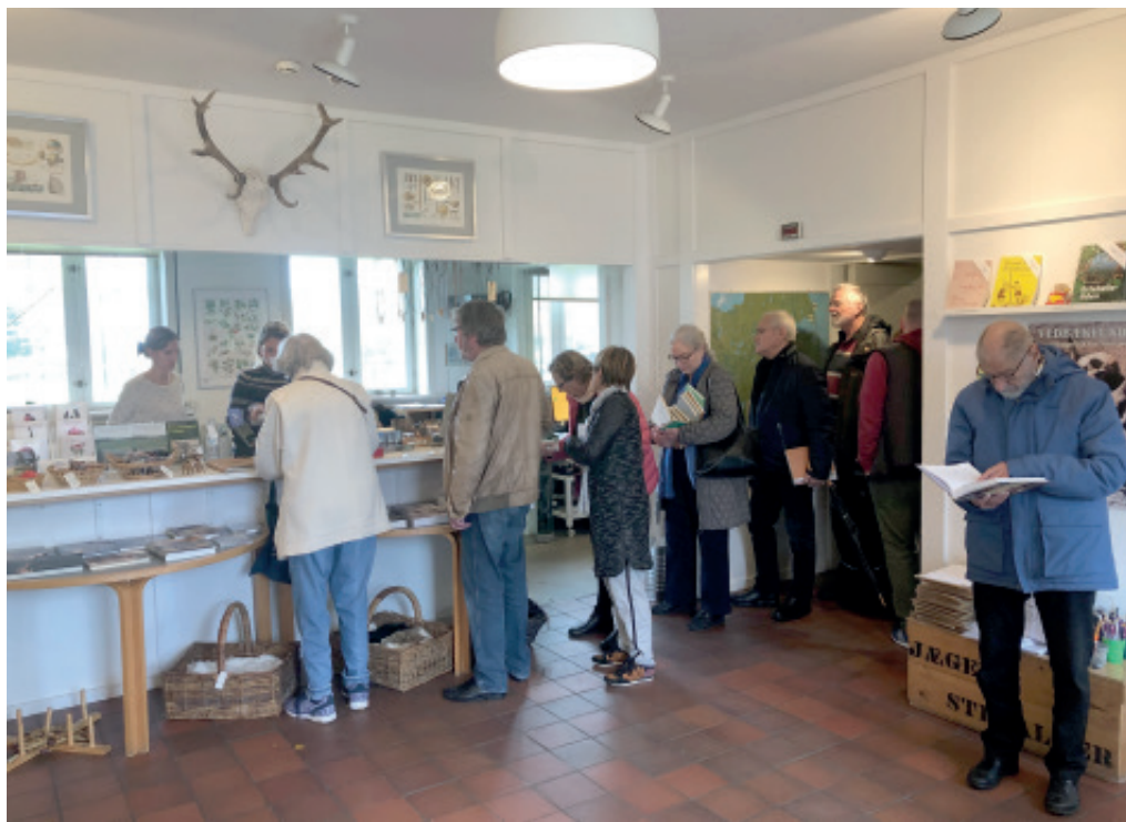
Der var mange gode tilbud til høstmarkedet den 13. oktober på Vedbækfundene.

Rudersdal Kommune, også består af repræsentanter fra HISTTOP og BLAM. Med disse gode lokalhistoriske kræfter drages der god omsorg for kommunens monumenter.