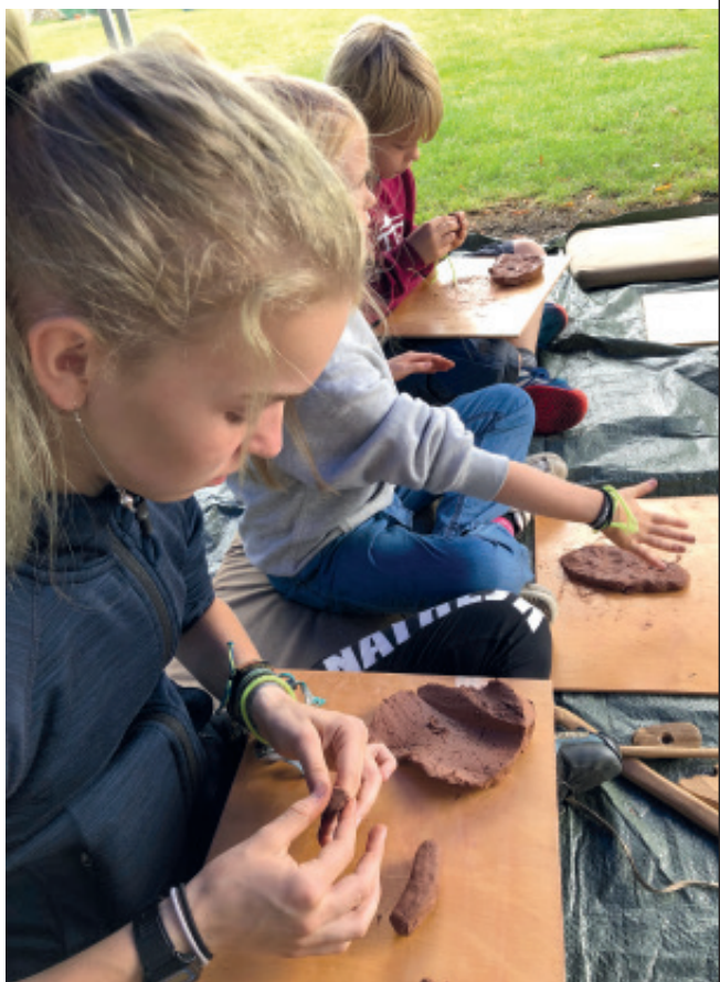
Til åben boplads prøver børn forskellige jægerstenalderaktiviteter som her, hvor de laver lerkar.

Der er dog stadig mange aktiviteter i relation til de eksisterende udstillinger på Gl. Holtegaard, og den 1. september afholdtes der "åben boplads" med mange gode aktivitetstilbud til hele familien, der desværre blev stærkt påvirket af et kedeligt vejr.