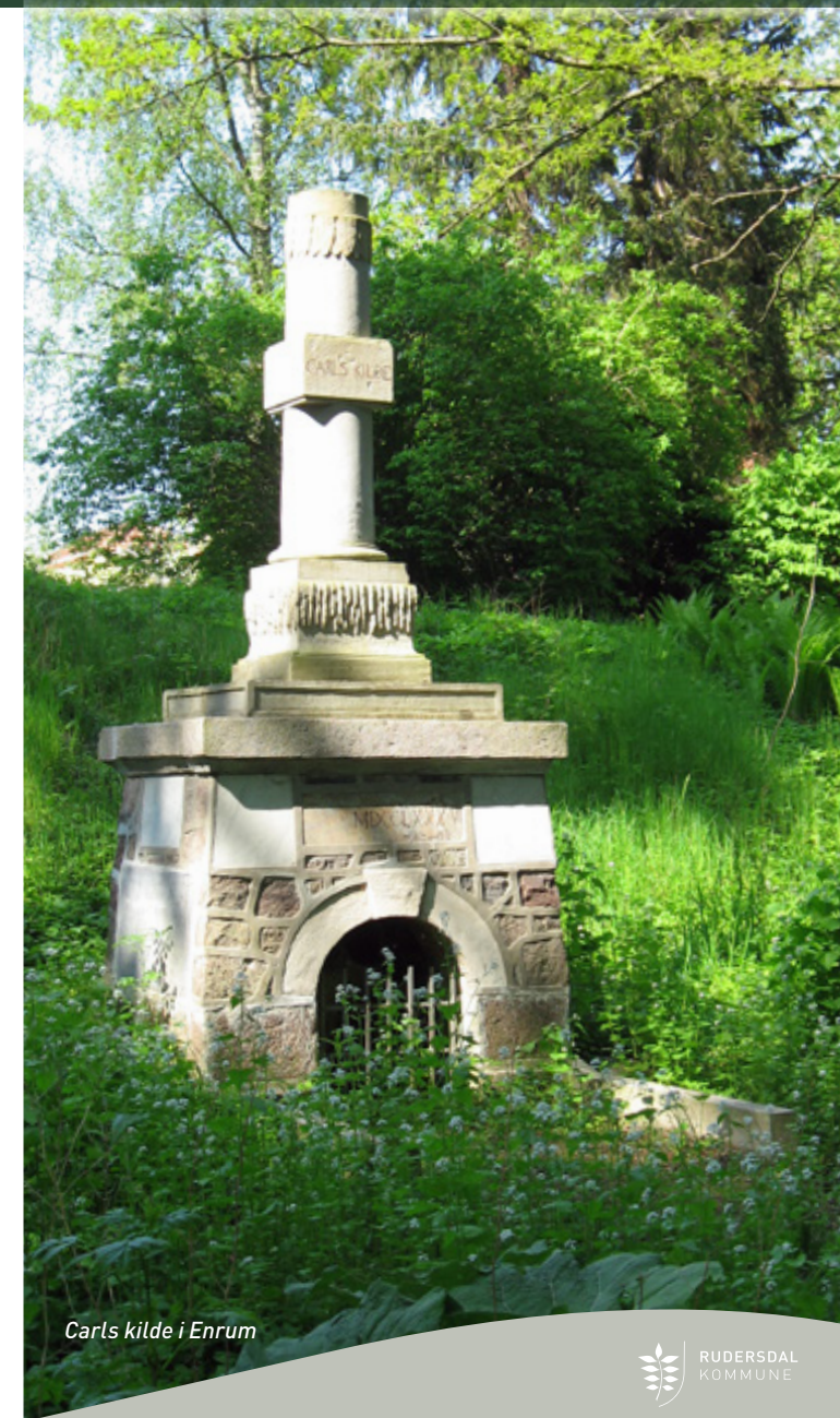
Carls kilde i Enrum